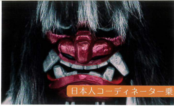
日本人コーディネーター乗船